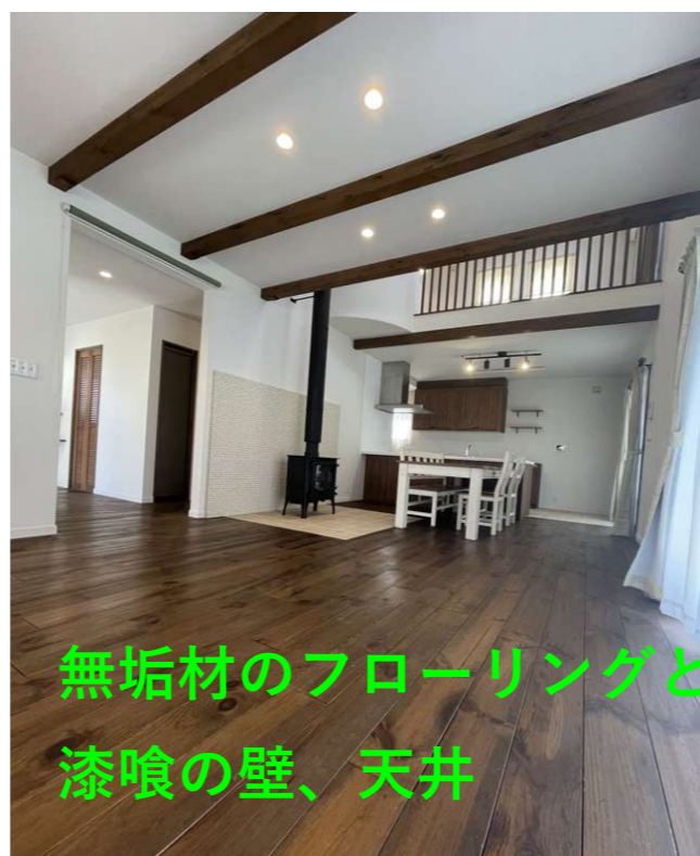
無垢材のフローリングと 漆喰の壁、天井