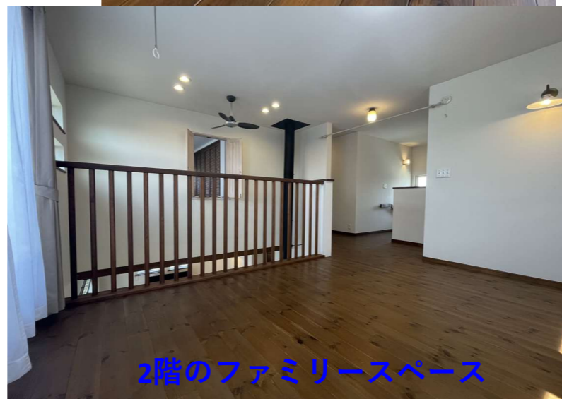
2階のファミリースペース