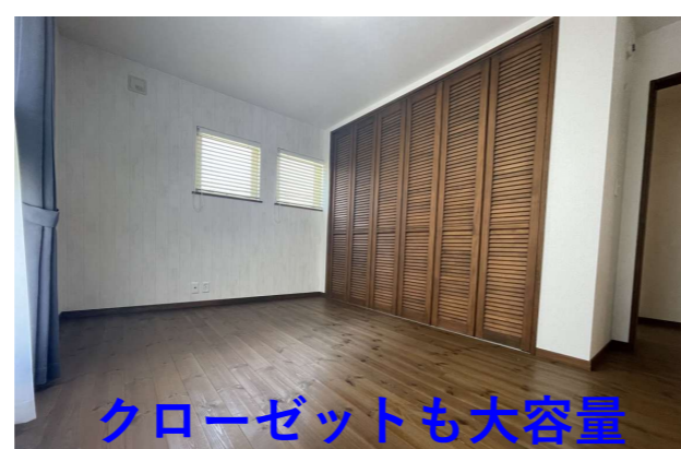
クローゼットも大容量