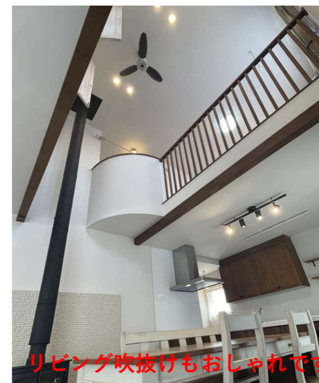
リビング吹抜けもおしゃれです