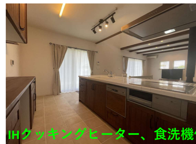
IHクッキングヒーター、食洗機付