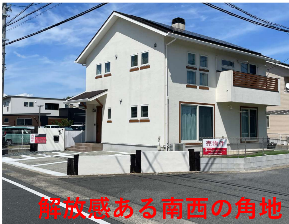
解放感ある南西の角地