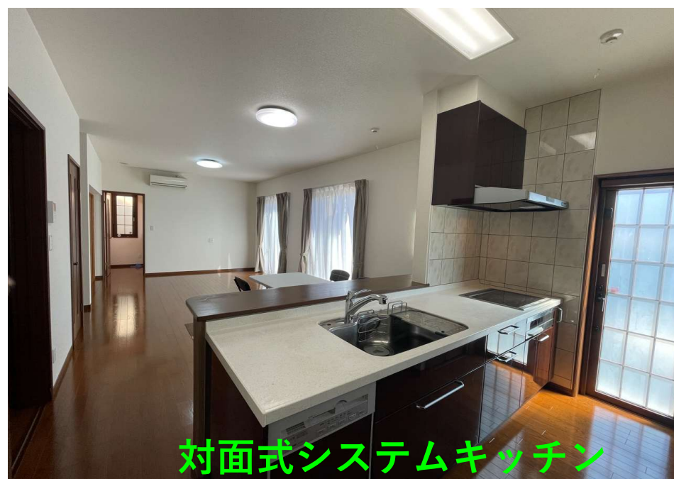
対面式システムキッチン