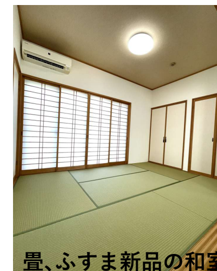
畳、ふすま新品の和室